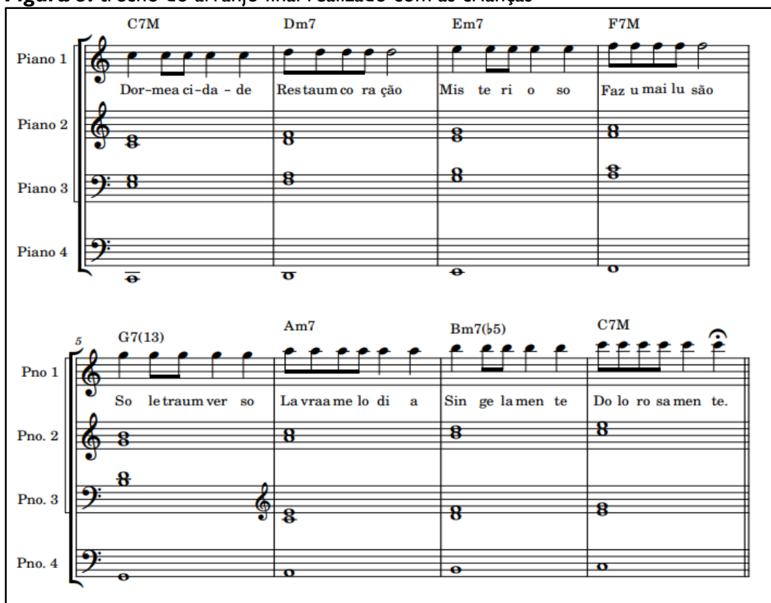
Figura 5: trecho do arranjo final realizado com as crianças

Na continuidade, foi adicionada uma nova linha harmônica constituída por terças sobrepostas, porém a partir da nota Mi (2), tocada por ambas as mãos com os dedos indicadores em “pontas” e duração de 4 tempos. Por fim, foram acrescentados os baixos dos acordes na região grave do piano preenchendo cada compasso. Depois de algumas experimentações, foi possível performar a música Minha Canção completa, conforme o arranjo delineado abaixo (figura 5).