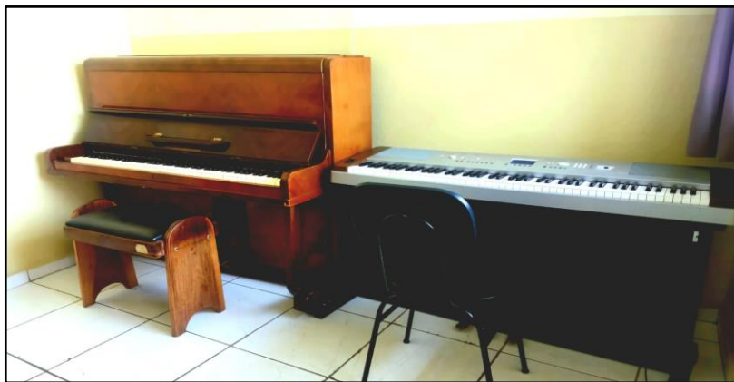
Figura 3: disposição dos 2 pianos na sala de aula

Mediante tais estratégias, rapidamente as crianças conseguiram tocar a melodia da música. Após a performance individual de cada aluno(a), as crianças foram divididas em grupos menores (duplas e/ou trios) para tocarem juntas. Isso foi possível porque a sala de aula dispõe de dois pianos - um acústico e um digital - alocados um ao lado do outro (figura 3).