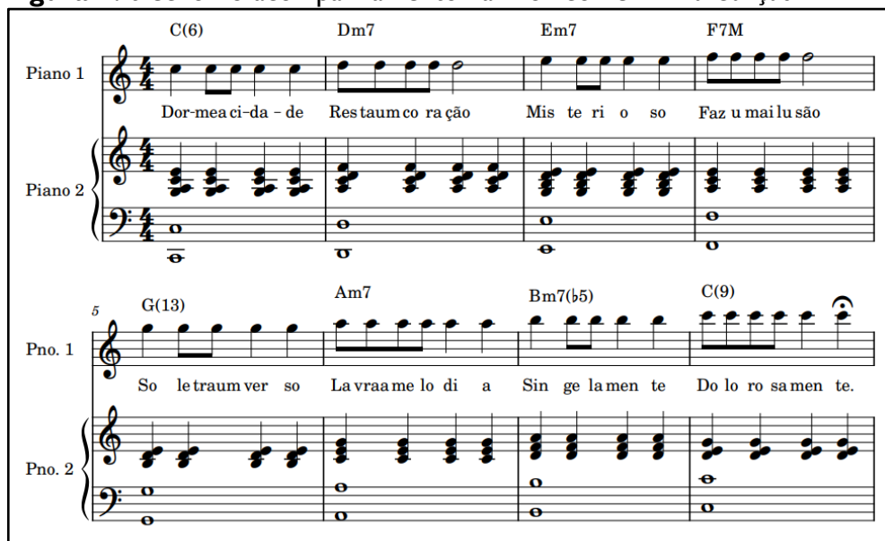
Figura 2: trecho do acompanhamento harmônico de Minha Canção

Na continuidade da atividade, um desafio musical foi proposto às crianças. Elas ouviram apenas o acompanhamento harmônico de Minha Canção , em estruturação similar à harmonização presente no vídeo utilizado no início do processo, como ilustra a figura abaixo (figura 2).