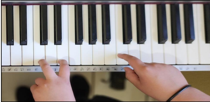
Figura 6: posição dos dedos 2 e 3 escolhida por algumas crianças

3 da mão esquerda (figura 6) e não 3 e 5 ou 2 e 4, associadas à melodia tocada pela mão direita, resultando em performances fluentes e expressivas.